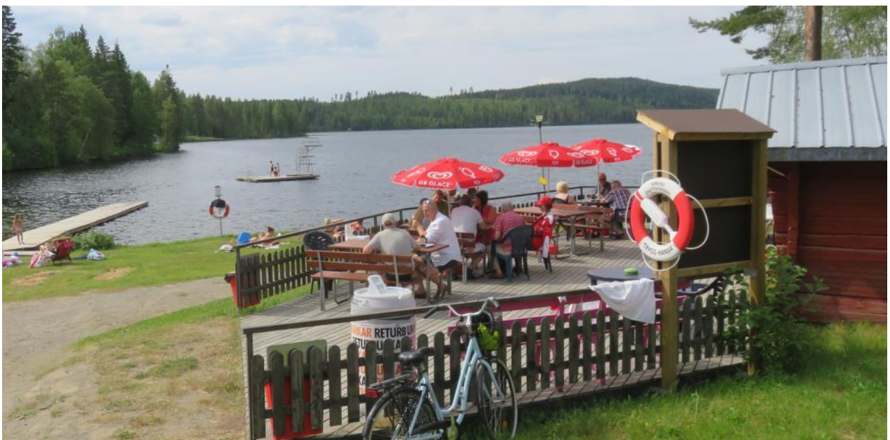
Badplatsen vid Vitträsket är ett uppskattat besöksmål i Råne älvdal under varma sommark dagar.