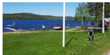
Städdag vid badstranden

På försommaren anordnas en städdag kring badstranden och idrottsgården och i år kommer föreningen även sammankalla en extra dag för att röja upp kring elljusspåret och förstärka vissa sträckor med grus samt även sprida ut bark på vissa sträckor.